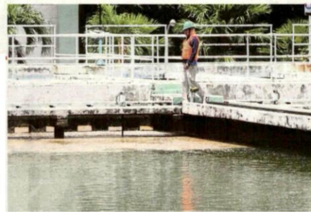
The Semenyih Water Treatment Plant was shut down last week due to odour pollution. FILE PIC