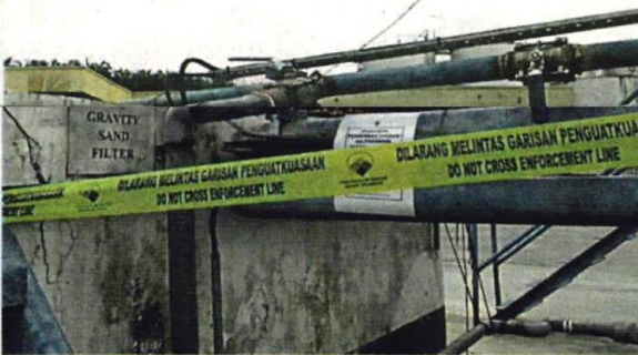
环境局援引 1974 年环境素质法令，下令涉及工厂停止污染及停运，直到进一步调查完成。

文告说，与此同时，国家水务委员会 (SPAN) 也将汲取污水样本在内的证据，并援引 2006 年水供服务工业法令 (655 法令) 第 121 (1) (C) 条文对此案展开调查，一旦罪成，可在第 121 (2) (B) 条文下，判处最多 10 年监禁或不超过 50 万令吉的罚款，或两者兼施。