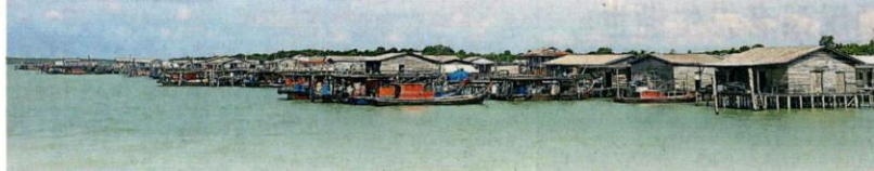
五条港渔村居民可通过土地临时使用准证计划，获得3年土地使用权，以供规划和建设发展提供便利。