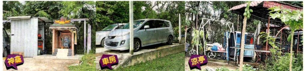
■居民霸占公共空间占为己有，违建各种各样的违建建筑，包括车房、凉亭、神龕及饲养鸡鸭狗的笼子等。