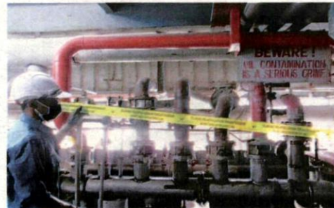
JAS telah melaksanakan penahanan operasi kelengkapan ke atas sebuah kilang berasaskan makanan yang disyaki menjadi punca pencemaran.

Menurutnya, beberapa sampel pelepasan efluen perindustrian dan sampel air sungai di muka sauk diambil pihak JAS