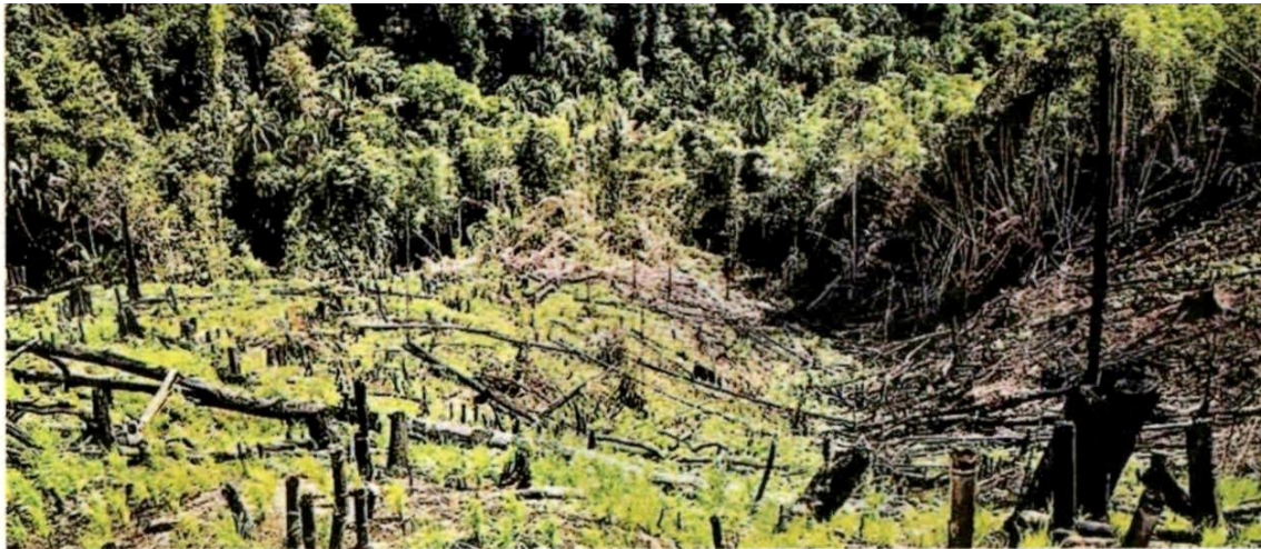
Di kawasan Hutan Simpan Sinderut, Lipis, Pahang inilah sekumpulan individu didakwa menceroboh untuk menghantar bantuan kepada penduduk kelmarin.