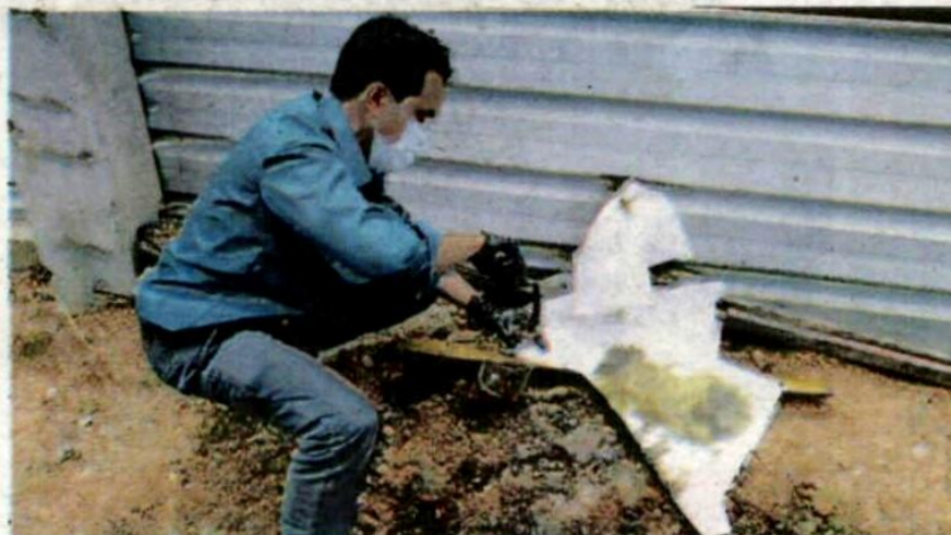
PEGAWAI JAS mengambil sampel lelehan minyak dari sebuah premis yang menjadi punca pencemaran Sungai Buah, Dengkil semalam.

“Kes akan disiasat di bawah Seksyen 25(1) Akta Kualiti Alam Sekeliling, 1974 dan Peraturan-Peraturan yang berkaitan,” katanya.