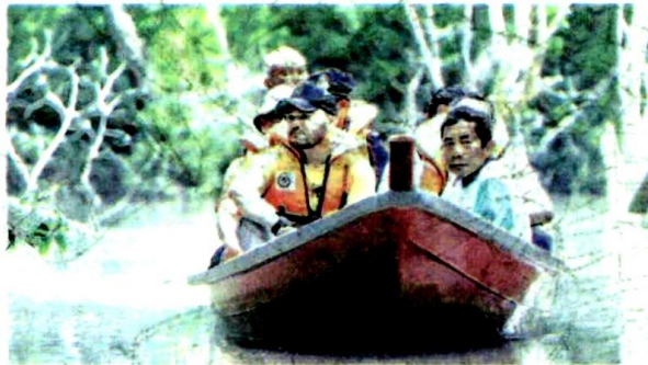
TENGGU Amir Shah menegaskan kawasan hutan paya gambut memainkan peranan yang penting dan nadi utama dalam penyerapan karbon bagi memastikan kadar pemanasan global dapat diatasi.

baginda begitu terkesan akan isu alam sekitar dan mengambil maklum bagaimana pembangunan meninggalkan impak mendalam terhadap perubahan iklim, generasi akan datang, bahkan kesan yang tidak dapat kita pulihkan.