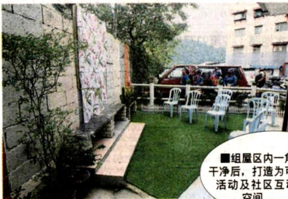
■组屋区内一角被整理干净后，打造为可进行休闲活动及社区互动的公共空间。

她希望公共空间能获得居民的善用及珍惜，同时成为范例供其他社区参考，也希望各地方政府能推动类似计划，在各社区内建设及打造一个公共空间。