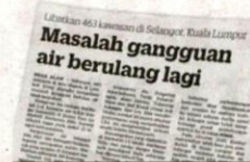
KERATAN Kosmo! 1 September 2021.

Berdasarkan petunjuk terbaharu itu, JAS telah melaksanakan penahanan operasi kelengkapan