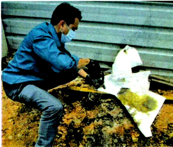
LELEHAN minyak dari sebuah premis menjalankan aktiviti penyelenggaraan jentera dan lori dikesan menjadi punca pencemaran Sungai Buah, Dengkil. - IHSAN JAS SEPANG

PUTRAJAYA: Kementerian Alam Sekitar dan Air mengesahkan kertas siasatan telah dibuka untuk mendakwa pemilik kilang yang disyaki menjadi punca pencemaran Sungai Semenyih.